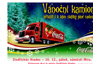
Jindřichův Hradec – 16. 12., pátek, náměstí Míru. Partneřem akce je město Jindřichův Hradec.

Před příjezdem samotného kamionu bude od jedné probíhat samostatný program. Na děti čeká spousta her, které rozzáří oči nejen malých návštěvníků. Děti budou moci vyzkoušet své dovednosti při vázání Santových bot. Pokud budou chtít, skřítkové je rádi vyfotografují se „Santou“ před kamionem. Fotografie budou pořizovány digitálním fotoaparátem a ukládány na internetové stránky, odkud si je budete moci stáhnout či vytisknout. Karaoke – zpívání vánočních koled – jistě ocení malí i velcí. Santa Claus bude mít pro každého připraveno mnoho dárků. Přijďte si s vašimi dětmi užít kouzelné odpoledne plné her, zábavy, hudby, zpěvu, dárků a překvapení – prostě odpoledne splněných přání!