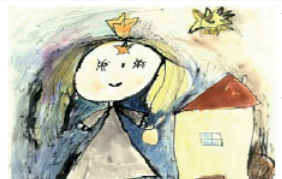
z archivu I. MŠ Růžová ulice J. Hradec