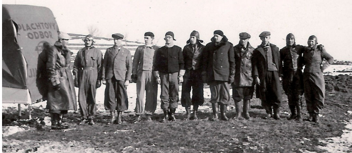
Létající členové MLL Jindřichův Hradec před létáním.