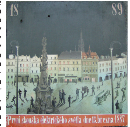
ostrožněleky terč ze sbírek Muzea Jindřichohradecka