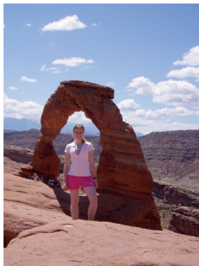
National Arches Park, Utah

Po příletu do New Yorku si naše skupinka českých a slovenských studentů musela vystát asi dvouhodinovou frontu u přepážky imigrační policie, kde nás div nesvlékli donaha, a poté jsme odjeli autobusem do hotelu. Projížděnou setmělým velkoměstem jsme se dostali do New Jersey, kde jsme byli ubytováni v luxusním hotelu a kde jsem se také setkala se studenty z celého světa, kteří se rozhodli pro pobyt v USA, zpro-